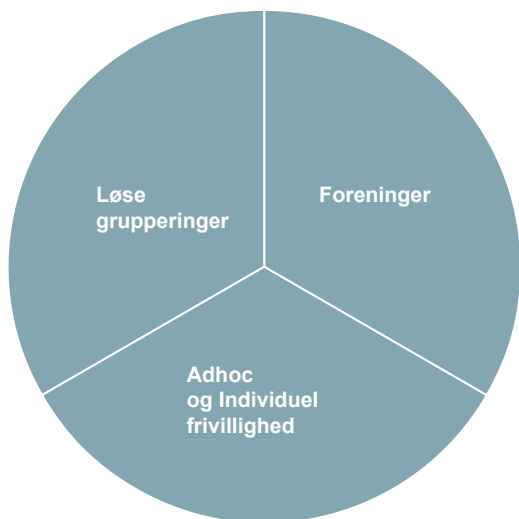
Figur 1 Organisering af frivillighed opdelt i "hovedgrupper"

Med frivillighedspolitikken for Ballerup Kommune vil vi understrege, at frivillighed kan være mange ting, og vi betegner alle, som yder en frivillig, aktiv og ulønnet indsats i Ballerup, som frivillige. I Ballerup Kommune er det betragtningen, at frivillighed er et supplement til og ikke en erstatning for en kommunal indsats.