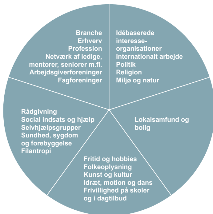
Figur 2 Områder hvor frivillige optræder/kan indgå

Til at understøtte samarbejdet mellem kommunen og frivilligheden på foreningsområdet, har Kommunalbestyrelsen valgt at etablere Frivillighedsrådet sammen med det lovpligtige Folkeoplysningsudvalg som demokratiske dynamoer for frivilligheden i Ballerup. De repræsenterer henholdsvis det frivillige sociale arbejde og det folkeoplysende arbejde i Ballerup Kommune.