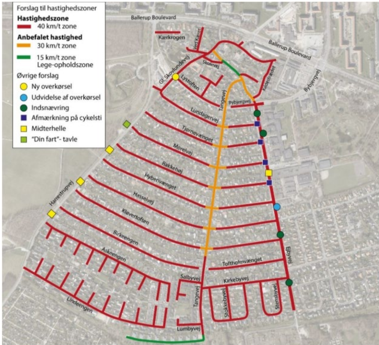
Figur 2. Oversigtskort der viser forslag til tiltag, der er beskrevet i rapporten.

Manglende udførsel skyldes i stort omfang økonomi.